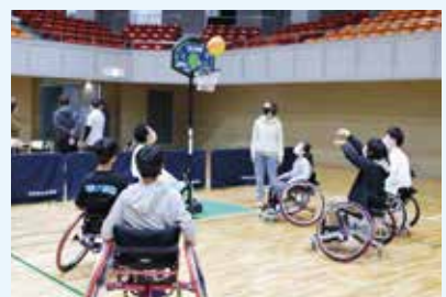
車いすバスケットボール