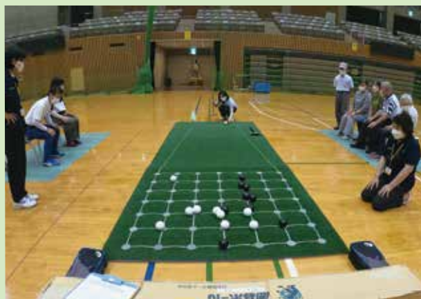
囲碁ボール交流会

今年も囲碁ボール交流会を開催します! 定期的に囲碁ボールを行っているという方は腕試しに、まだ囲碁ボールをやったことがない方も、囲碁ボールの第1歩として参加してみませんか?