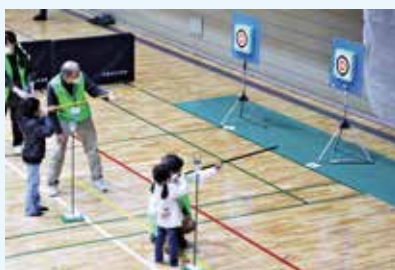
スポーツウエルネス吹矢

卓球、野球、ソフトテニス、陸上、柔道、バレーボール、剣道、水泳、空手、バスケットボール、ソフトボール、新体操、テニス、バドミントン、サッカー、なぎなた、ゲートボール、ゴルフ、太極拳、ラグビー、車いすバスケットボール、スポーツウエルネス吹矢など様々な体験教室に自由に参加することができます。皆さまのご来場をお待ちしています。