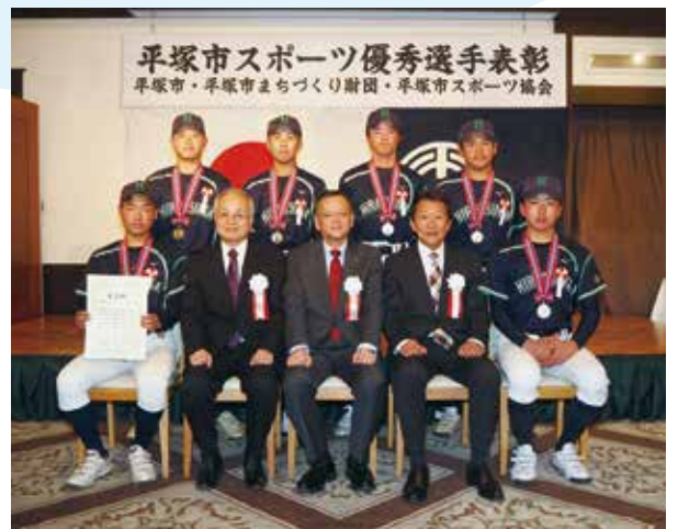
団体表彰された皆さん