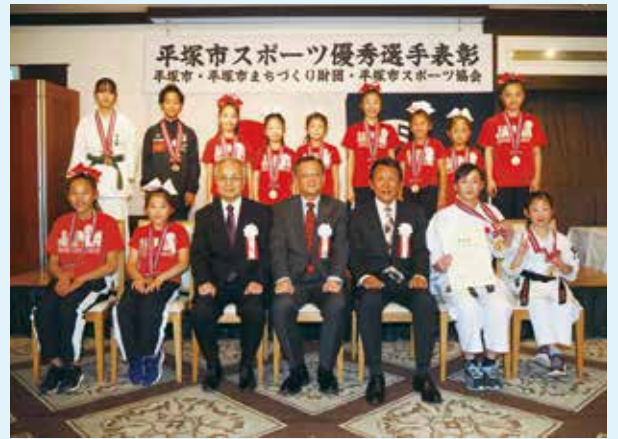
個人表彰された小学生の皆さん