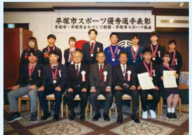
個人表彰された中学生・高校生の皆さん