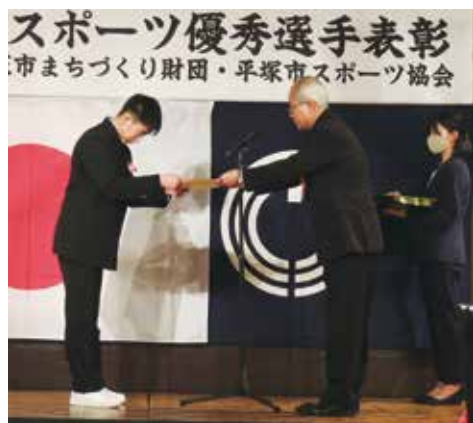
井上財団理事長から表彰される個人表彰者