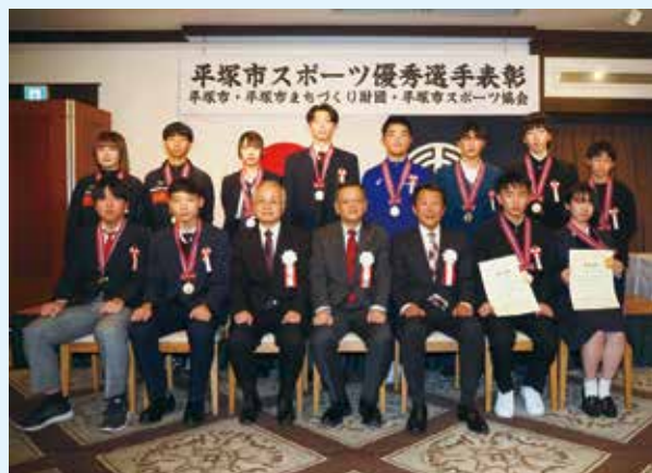
個人表彰された中学生・高校生の皆さん