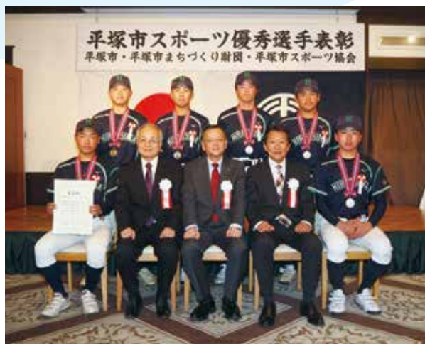
団体表彰された皆さん