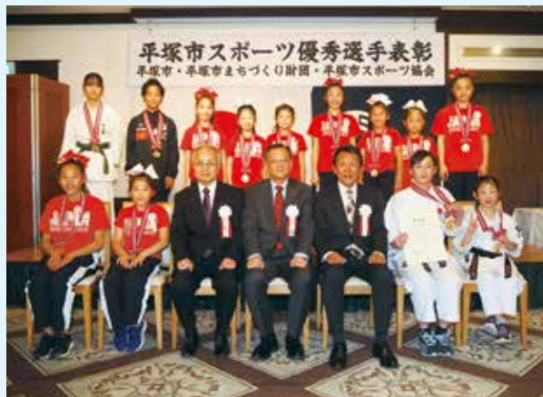
個人表彰された小学生の皆さん